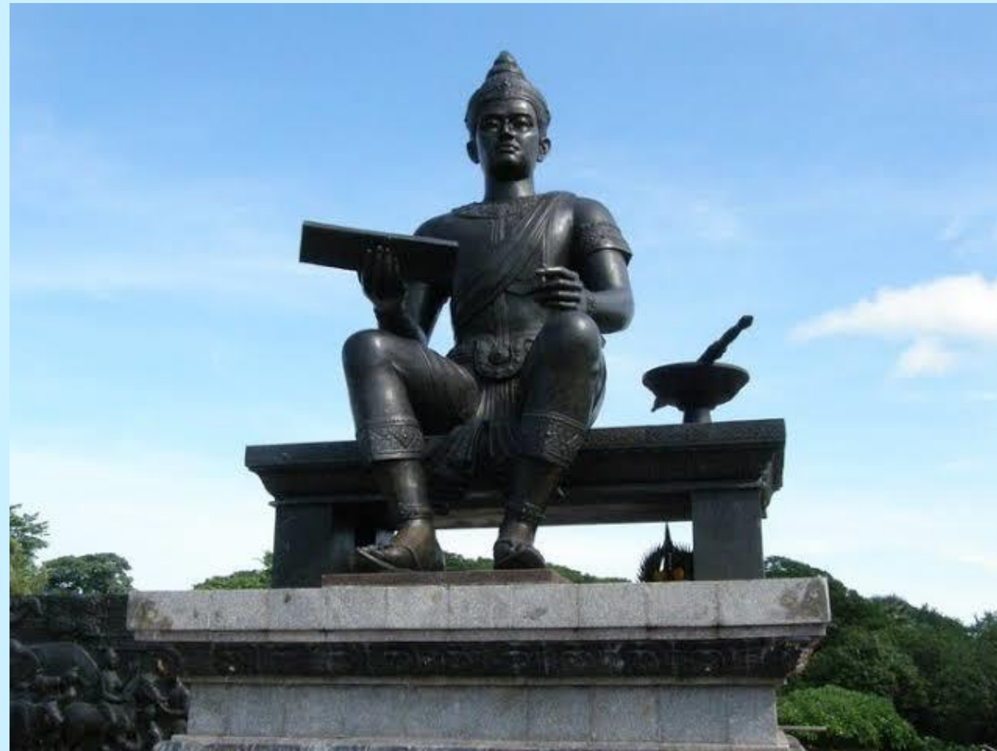
พ่อขุนรามคำแหงมหาราช