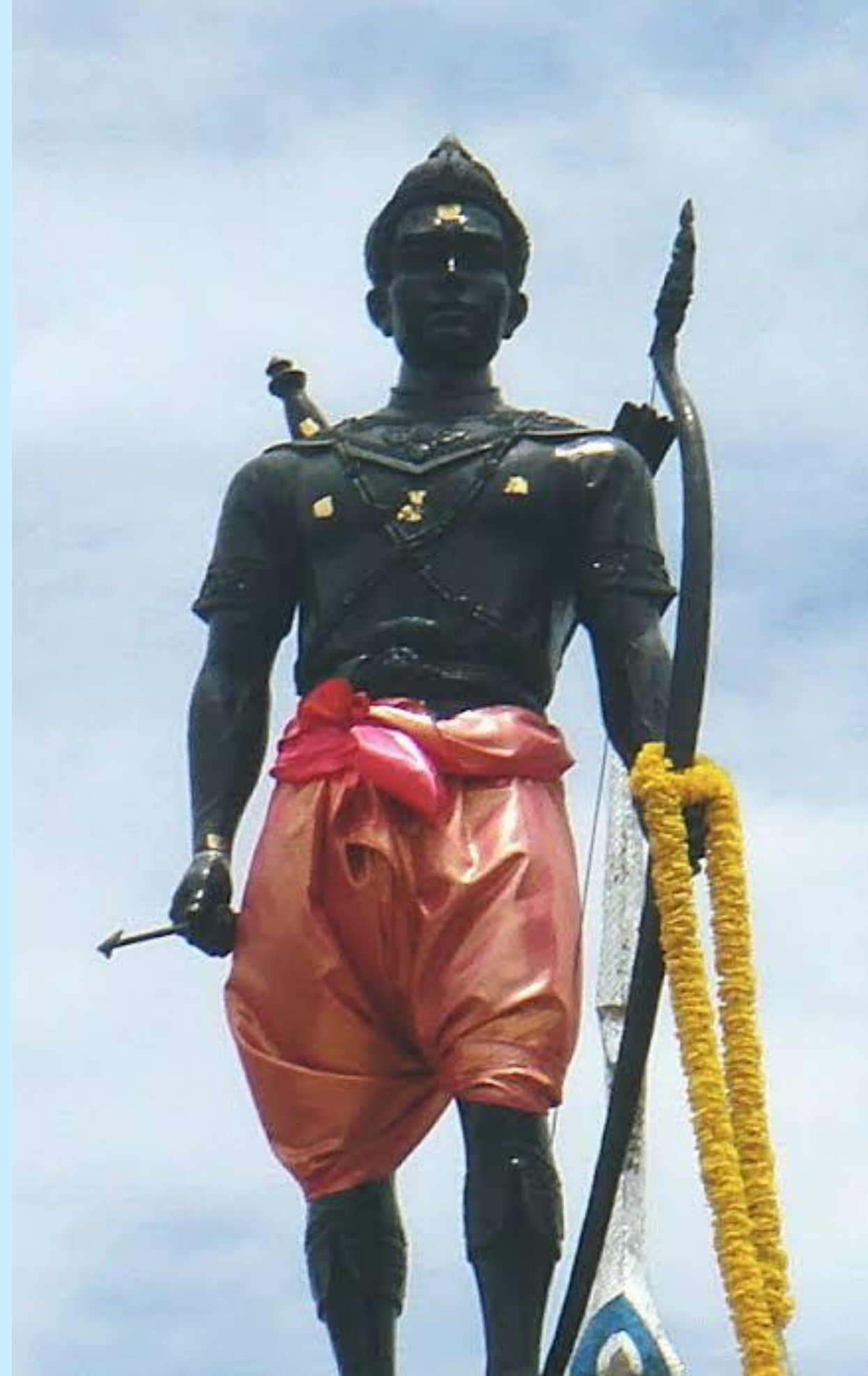
พ่อขุนศรีอินทราทิตย์